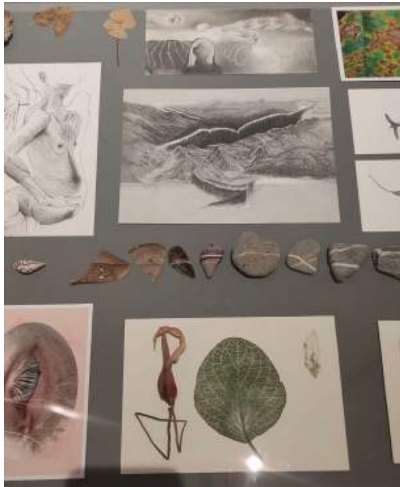
Alejandro García Restrepo Ejercicio de mnemotecnia 2019 Dibujos, grabados, fotografía y objetos encontrados 120 x 60 x 84 cm