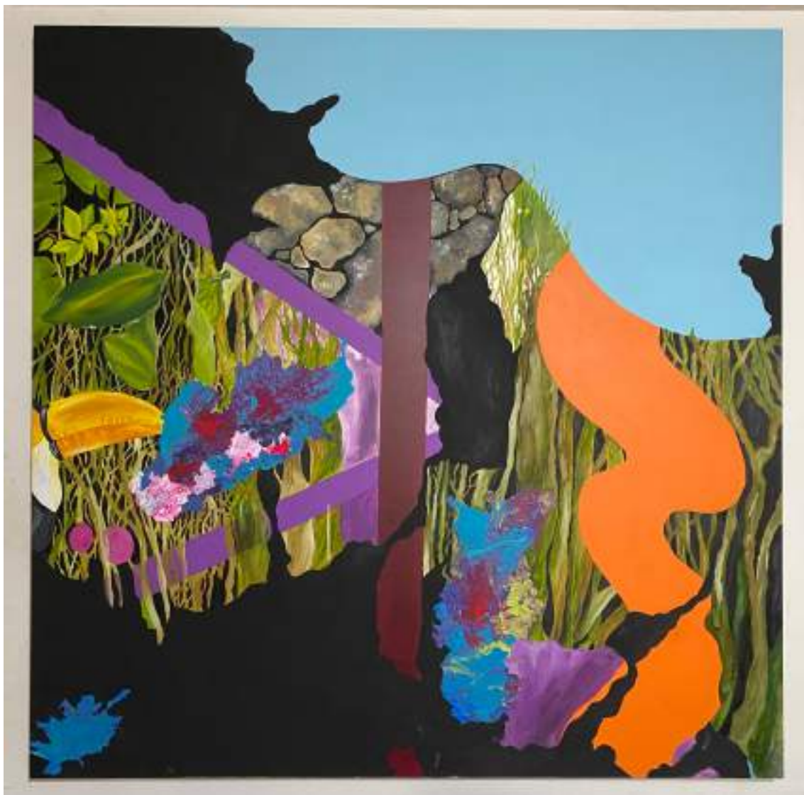
Oleo y acrilico sobre tela 150 x 150cm

Gracias a los elementos e ideas que seguían creándose, experimenté a través de la pintura: trabajé con manchas negras simulando el mapa, el cuál se ve atravesado por diferentes paisajes de color y formas figurativas. De esta manera encontré un camino interesante para desarrollar a futuro; del mismo modo, contribuyó al desarrollo de mi proyecto.