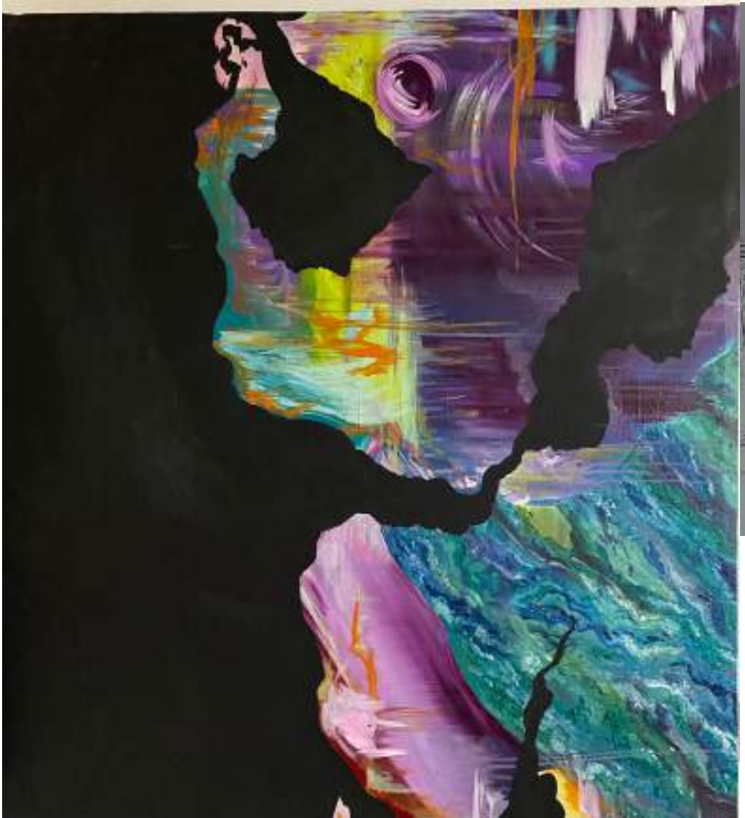
Oleo y acrilico sobre tela 120 x 70 cm